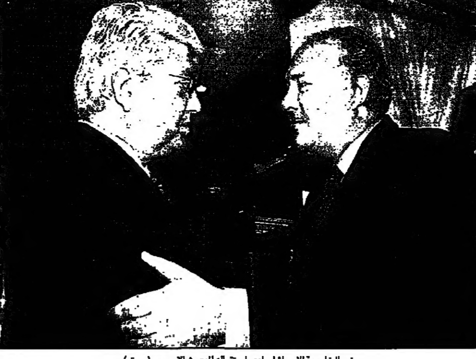
وزير الخارجية الاسرائيلي لدى استقبله المبعوث الاوروبي (رويتز)